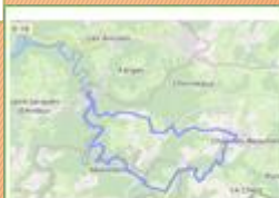
Chapdes-beaufort – Montfermy – La chartreuse