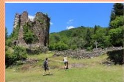
La Chartreuse Port-Sainte- Marie