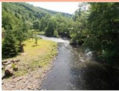
Sur les pas des Chartreux